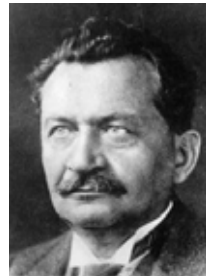
Otto Wels (1873-1939)

Quelle: Dt. Historisches Museum, Berlin www.dhm.de