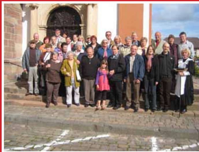
2010 SPD-Ausflug nach Edenkoben