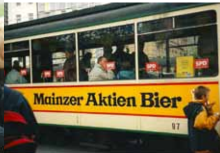
1996 SPD-Ausflug (Mit der historischen Tram durch Mainz)